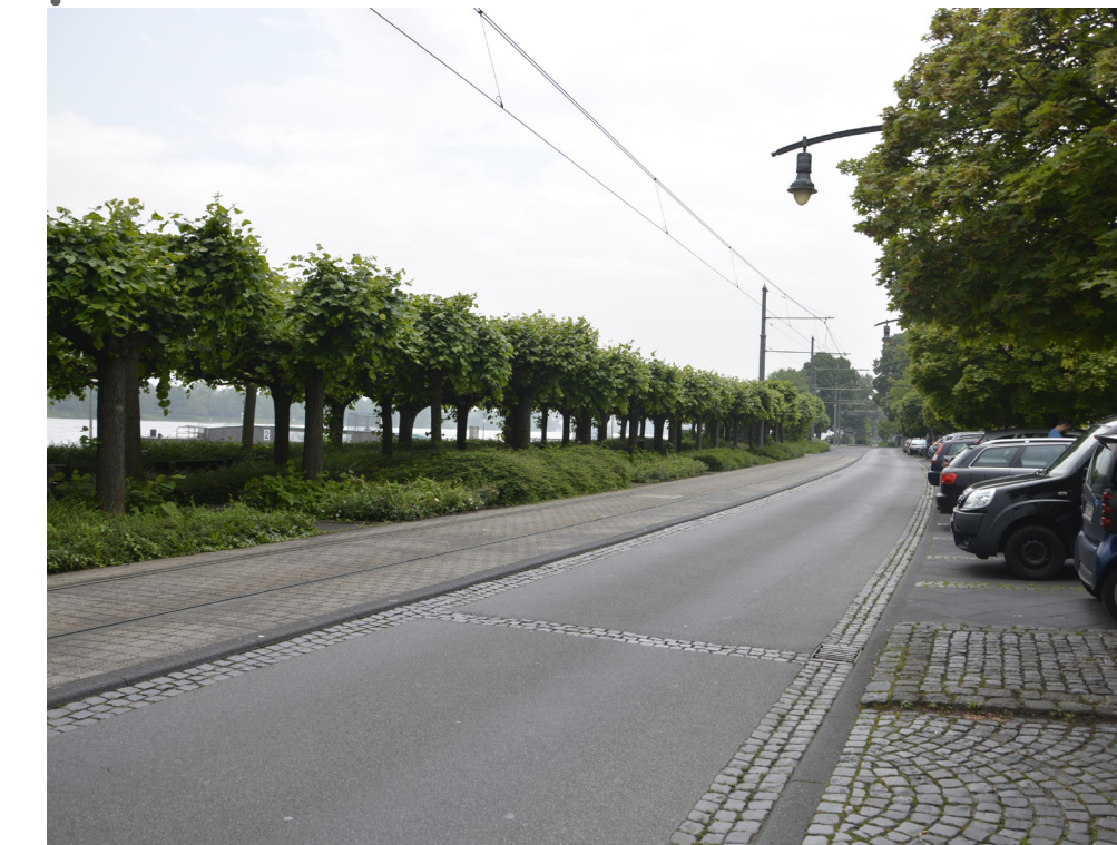
Vorhandene Platanen-Allee als „Grüne Spange“ der Promenade