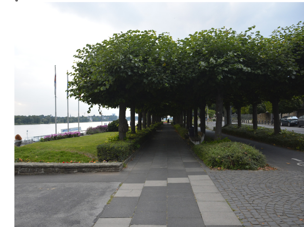
Dunkler Fuß- und Radweg durch die doppelte Allee