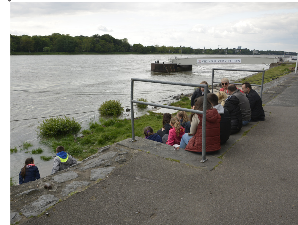
Zugang zum Wasser