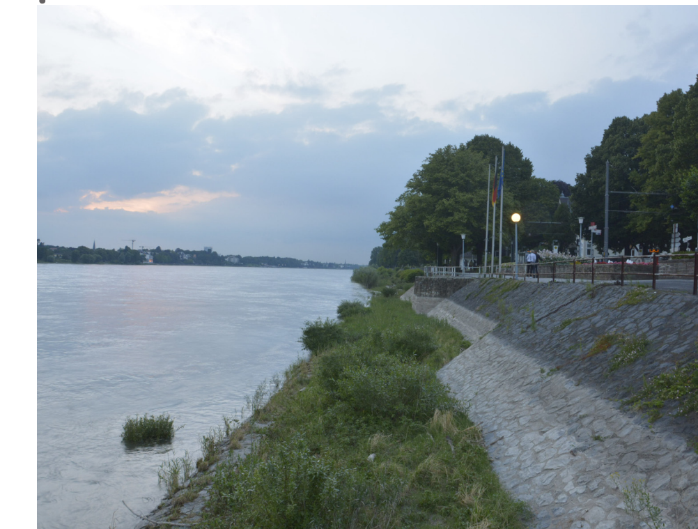
Großes Potenzial durch die Lage am Wasser