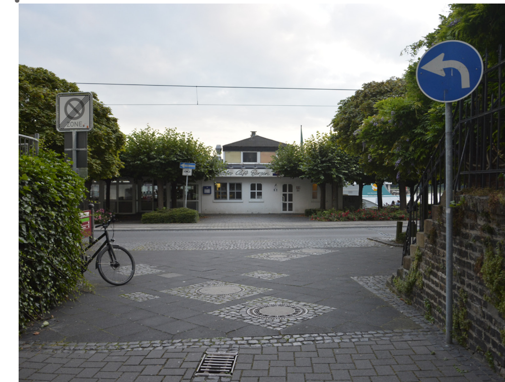
Fehlender Sichtbezug zum Wasser aus der Altenberger Gasse